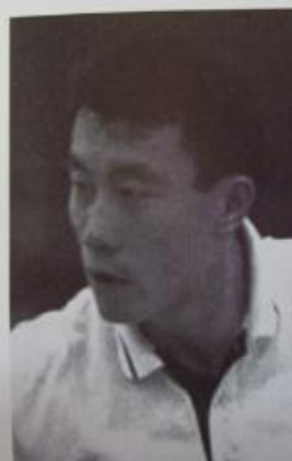
Table Tennis Stars Shine Brightly In Baltimore!